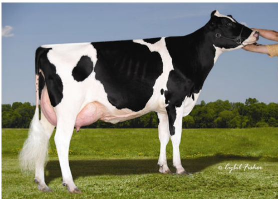
CHERRY CREST MANOMAN ROZ THIRD DAM