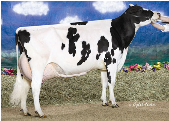
WHITTIER-FARMS OUTSIDE ROZ FIFTH DAM