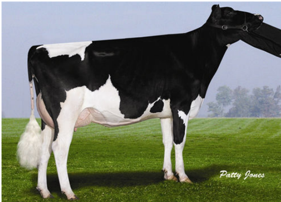
WHITTIER-FARMS HE REBECA FOURTH DAM